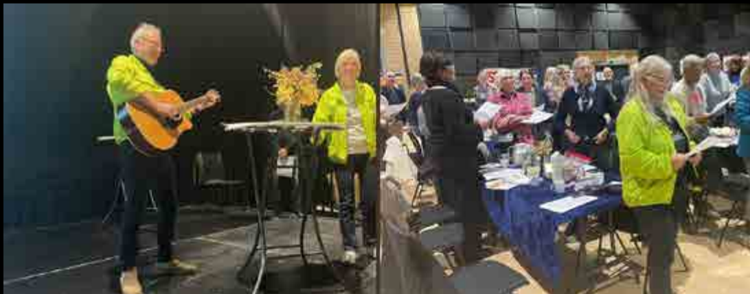
Dagen startede med fællessang