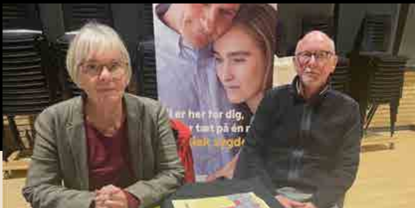
Sundhedsdagen satte fokus på civilsamfundets bidrag til mental sundhed og trivsel