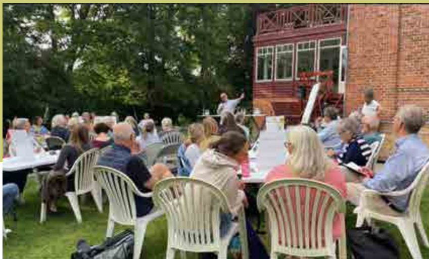
En inspirerende aften om Rudersdals grønne fremtid